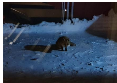
Bild: Besuch trotz Corona: Diesem Fuchs scheint es bei uns zu gefallen!

Wir hoffen sehr, dass wir das geplante Programm durchführen können. Mehr Informationen wird es zeitnah zum Termin geben.